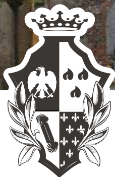
Castello di Malpaga